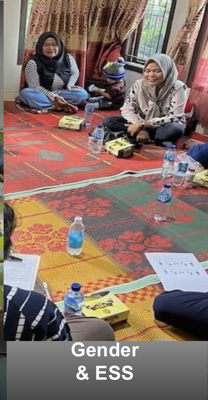
Gender & ESS